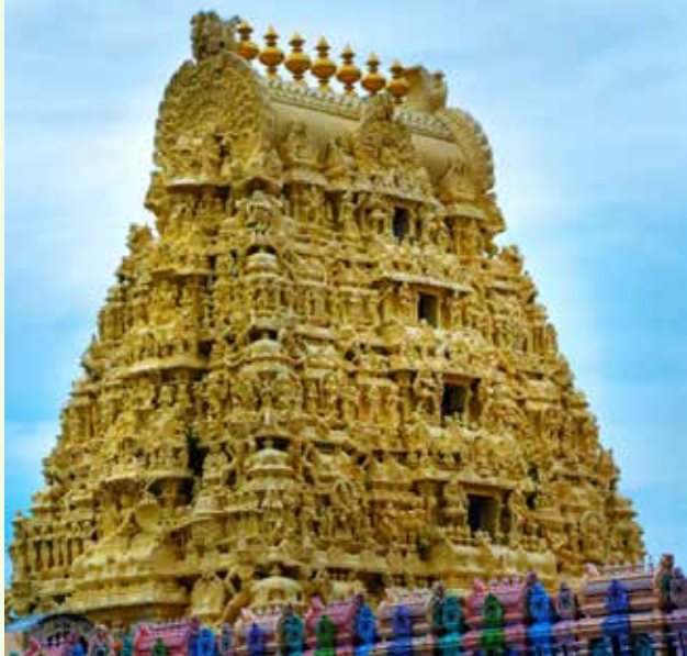
Tempio Sri Ekambaranathar

Partenza al mattino per l'escursione a Kanchipuram, la "città d'oro", una delle sette città sacre dell'India induista, dove si possono visitare numerosi templi induisti costruiti in epoche diverse e sacri a Shiva e Vishnu. Nel momento di massimo splendore del regno Pallava ne divenne capitale e furono costruiti alcuni dei templi più importanti; conquistata in seguito dai Chola, nel XIV secolo passò sotto il raja di Vijayangar. Contesa da inglesi, francesi e musulmani nel periodo coloniale, oggi Kanchipuram è famosa per il suo patrimonio monumentale e per le raffinatissime sete tessute a mano.