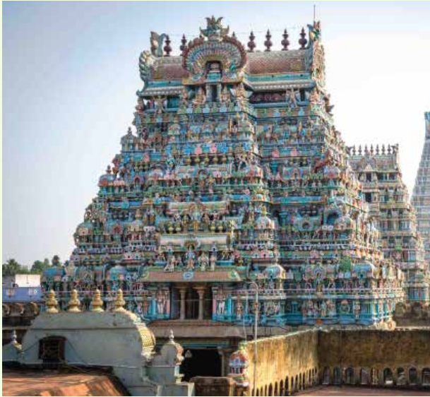
Sri Kapaleswarar Temple

La visita prosegue con la Cattedrale di Santhome, la National Art Gallery, il Forte St. George edificato nel 1640 d.C., un tempo prima difesa della East India Company, oggi sede di uffici governativi. Cena e pernottamento in hotel.