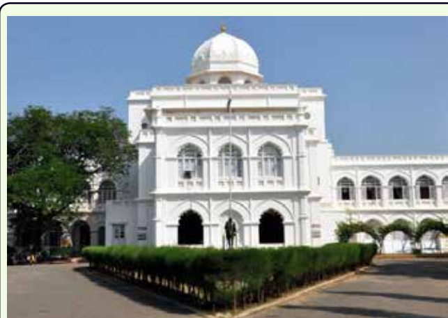
Gandhi Memorial Museum

Città molto animata e vivace anche se non così opprimente come altre metropoli indiane. È praticamente un grande bazar affollato di tutto: negozi, pellegrini, templi, mendicanti, mercati, carri trainati da buoi, riscio, alberghi di tutti i tipi, ristoranti e botteghe. Considerata la culla della cultura Tamil è una delle città sante più affascinanti dell'India.