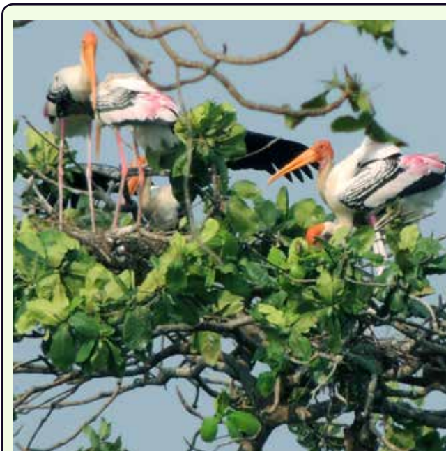
Kumarakom Bird Sanctuary

10° giorno, venerdì 10 luglio 2020 KUMARAKOM - COCHIN (70 km)