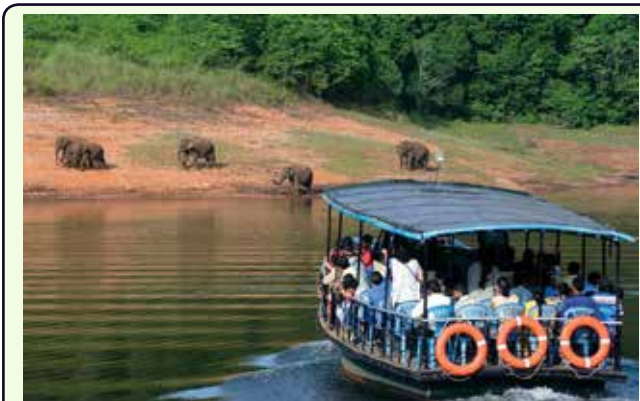
PARCO NAZIONALE di PERIYAR

giungla di alberi sempreverdi e savana che offre asilo a molte specie di animali selvatici, soprattutto elefanti. È stata dichiarata zona protetta per tigri e leopardi. Arrivo e sistemazione in hotel.